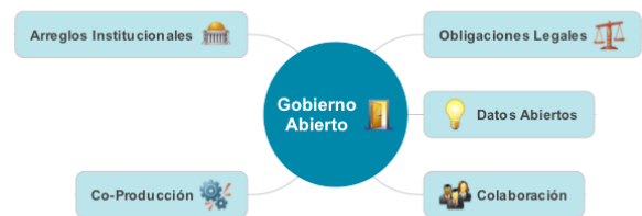
Figura 3. Modelo de Medición de Gobierno abierto para portales Web

modelo teórico para que retome varias de estas ideas, se ajuste a los temas actuales y pueda medir con mayor eficacia los esfuerzos de transparencia gubernamental. Este modelo supone la existencia de todos los componentes en los portales de internet de transparencia en la actualidad. Los cinco componentes que lo conforman se presentan en la figura 3 y se describen a continuación.